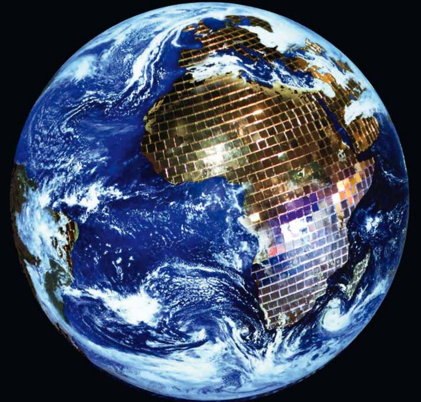
Alle Illustrationen / all illustrations: Theo Eshetu, 2013, in Zusammenarbeit mit / in collaboration with Latig Di Cenzo

Text: Dr. Jennifer Allen Deutsche Übersetzung: Angela Rosenberg